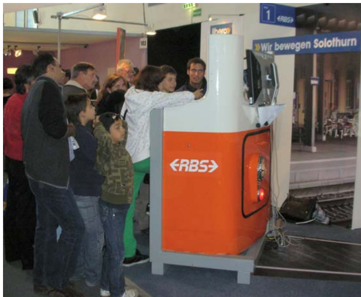
Impiego all'esposizione autunnale di Soletta HESO 08 I simulatori sono un magnete per il pubblico di prim'ordine...