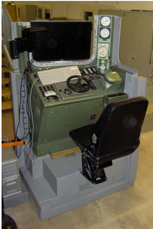
Führerpult eines Steuerwagens von RBS