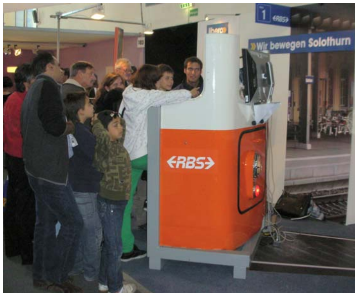
Einsatz an der Solothurner Herbstmesse HESO 08 Simulatoren sind Publikumsmagnete ersten Ranges